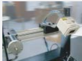
専用位置制御トラバサ(1m)