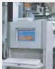
NEMA12対応 専用収納ケース