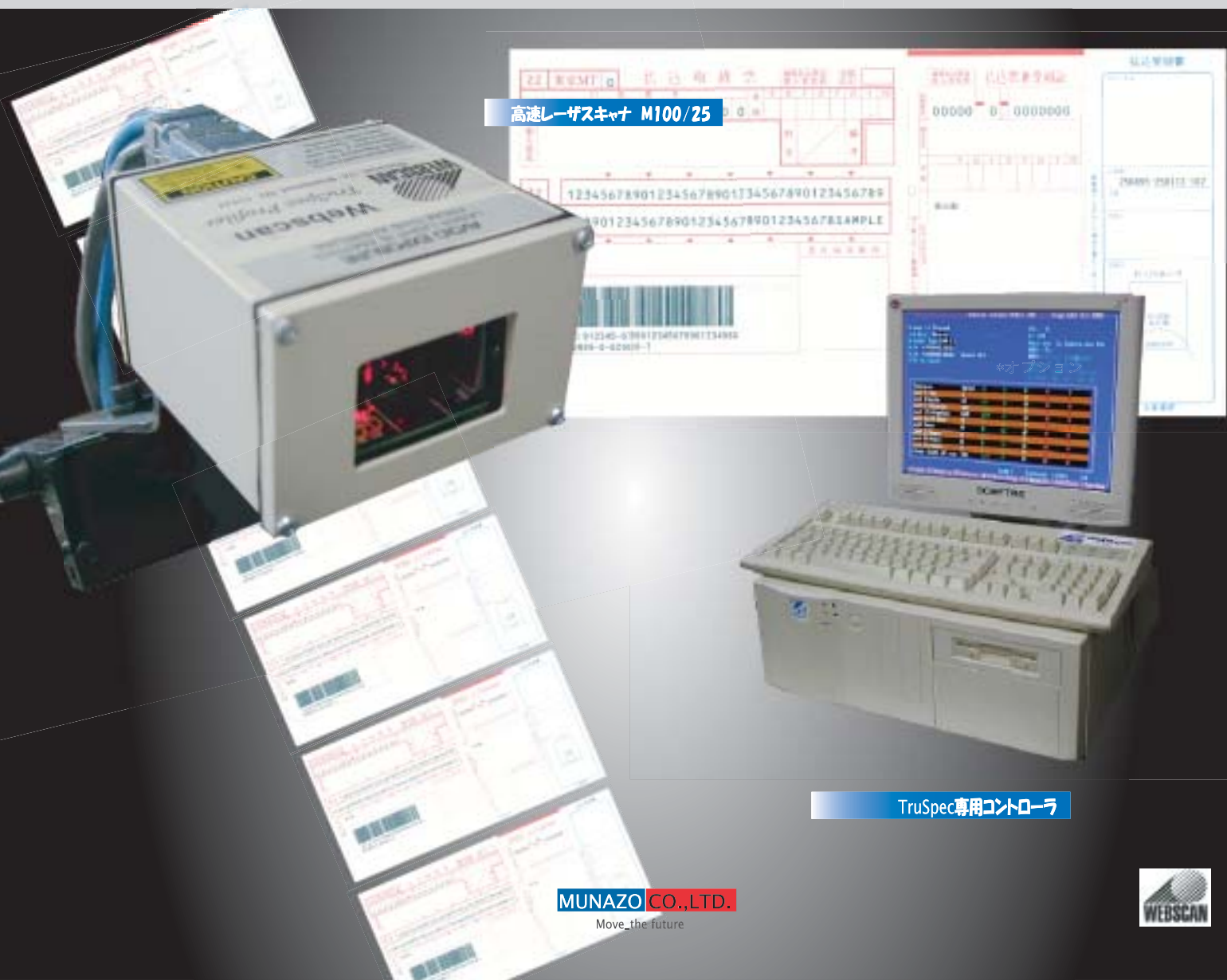
高速レーザーキャナ M100/25